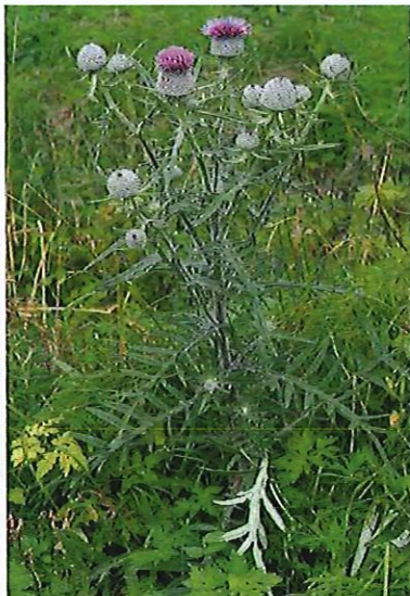
le cirse laineux Cirsium eriophorum